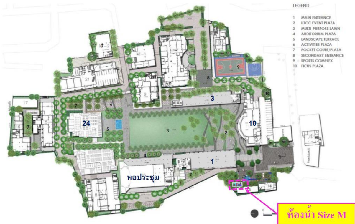
รูปที่ 1 ตำแหน่งห้องน้ำขนาด M

การจัดทำคู่มือนี้เพื่อเป็นแนวทางปฏิบัติให้กับเจ้าหน้าที่รักษาความสะอาดหรือการจ้างเหมาบริษัทเอกชน ผู้ที่ได้รับการคัดเลือกได้เข้ามาบริการทำความสะอาดห้องน้ำด้านหน้าของมหาวิทยาลัยหอการค้าไทย ดังแสดงได้ตามตำแหน่งในรูปที่ 1 มีรายละเอียดห้องน้ำขนาด M ซึ่งประกอบไปด้วย ห้องน้ำชายจำนวน 2 ห้อง ห้องน้ำหญิงจำนวน 3 ห้อง และห้องน้ำ Universal Design (UD) จำนวน 1 ห้อง รวมพื้นที่ก่อสร้าง 37.5 ตารางเมตร ด้วยงบประมาณการก่อสร้างทั้งสิ้นจำนวน 1,550,000 บาท และได้รับสนับสนุนเฉพาะแบบก่อสร้างจาก SCG ดังนั้นกองอาคารและสิ่งแวดล้อมได้ตระหนักถึงประสิทธิภาพ ประสิทธิผลและการให้บริการ จึงได้กำหนด วิธีทำความสะอาด อุปกรณ์ กฎระเบียบ ข้อบังคับ แนวทางการปฏิบัติงานรักษาความสะอาดและการติดตามผลการปฏิบัติงานรักษาความสะอาดซึ่งจะได้กล่าวต่อไปในรายละเอียดบทต่อไป